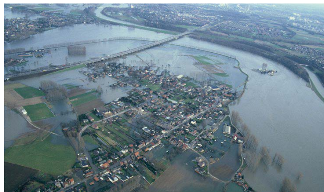
Hoogwater op de Maas

De beoordeling van de buitendijkse versterking vindt plaats in overleg met de rivierbeheerder conform de methodiek uit het rivierkundig beoordelingskader van Rijkswaterstaat, te vinden op de Helpdesk Water 2 . In dit kader zijn ook de principes van compensatie van bergend vermogen en waterstandseffecten toegelicht. De begrenzing van het rivierbed, waarover Rijkswaterstaat het waterstaatkundig beheer voert, is eveneens te vinden op de Helpdesk Water 3 .