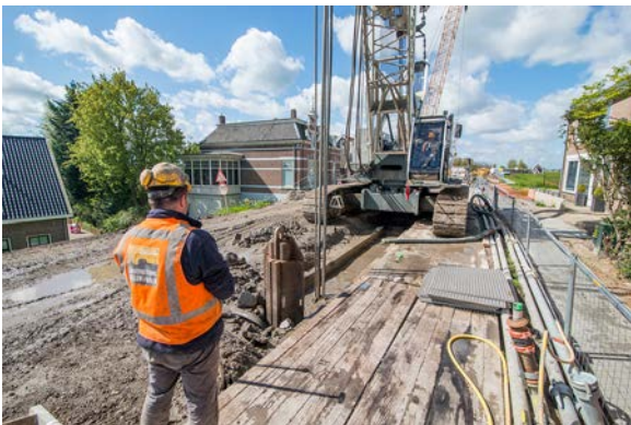
Lekdijk bij Streefkerk

Een riviertakanalyse brengt alle (verwachte) buitendijkse versterkingen in beeld – voor de korte en zo mogelijk de lange termijn - in samenhang met de gewenste of geplande compenserende maatregelen. De dijkbeheerder neemt het initiatief voor de analyse. De rivierbeheerder kan hierbij ondersteunen. Conform de redenerlijn is het uitgangspunt dat er over de gehele riviertak geen waterstandverhoging plaatsvindt. De riviertakanalyse geeft de beheerders houvast om op basis van deze analyse afspraken te maken over tijd- en plaatsafhankelijke compensatie van waterstandseffecten.