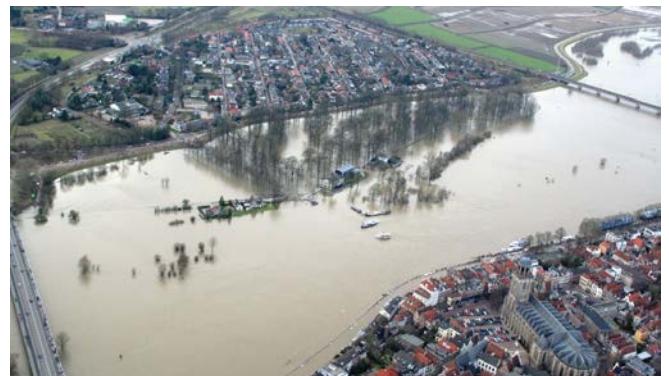
Hoogwater bij Deventer

rivierbed, zoals buitendijks versterken, wordt deze ruimte geclaimd en kunnen waterstandsverhogende effecten of verlies aan bergend vermogen optreden. De effecten van individuele activiteiten kunnen klein zijn, maar de gezamenlijke effecten van de diverse claims kunnen wel significant zijn. Rivierbeheer is dan ook gebaseerd op de samenhang in het gehele systeem. De rivierbeheerder is verantwoordelijk om deze samenhang in het oog te houden. Voorwaarde is dat de rivier over het geheel voldoende ruimte behoudt en dat alle waterkeringen uiterlijk in 2050 aan de norm voldoen.